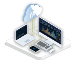
Sistema de Monitoramento